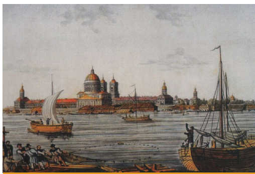
1840—1848 Алекса́ндро-Невская ла́вра

По мере возведения монастыря у его стен вырос городок (слободы с деревянными домами для работников и слуг), был разбит сад и огород, которые кормили братию. Вокруг поднялись хозяйственные постройки — куз-