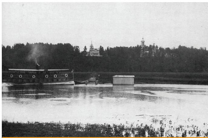
Вид Серафимо-Антониевского скита со стороны реки Луги

Реализация плана Трезини затянулась на долгие годы. Основная часть строительных работ пришлось на правление Елизаветы Петровны и на первую половину царствования Екатерины II. Собор, возведённый по первоначальному проекту, пришлось разобрать. Его новый проект разработал Иван Старов, который включил в состав монастырского комплекса всё левобережье Монастырки и разбил перед входом в обитель Александро-Невскую площадь.