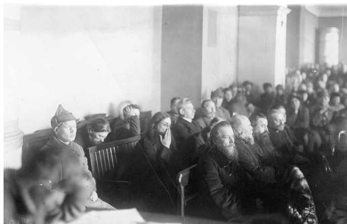
Судебный процесс над группой церковников Александрo-Невской лавры

была изъята и поступила в Государственный Эрмитаж, а мощи 15 ноября были переданы в фонды Государственного музея истории религии и атеизма.