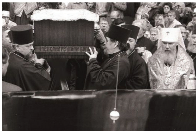
Возвращение мощей святого князя Александра Невского в Лавру (3 июня 1989 г.)

В рамках кампании по «изъятию церковных ценностей в пользу голодающих» 12 мая 1922 года была вскрыта рака Александра Невского. Серебряная рака