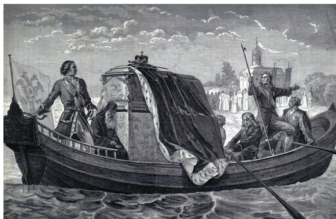
Перенесение мощей св. благоверного князя Александра Невского, Петром I, 30 августа 1724 года в Санкт-Петербург

С учреждением в 1742 году Санкт-Петербургской епархии её правящие архиереи стали священноархимандритами (настоятелями) монастыря. До этого на протяжении 20 лет он служил местом пребывания новгородских архиереев.