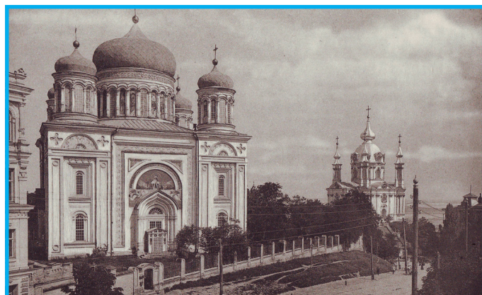
соборный Киевский храм, Десятинная церковь

И вот в конце одной такой молитвы предстал перед Ней Архангел Гавриил, который не раз являлся Ей, возвещая веления Божии. Сияющий радостью, Он сообщил Ей, что через три дня закончится путь Ее земной жизни, и Бог возьмет Ее в Свои вечные обители. При этом Он дал Ей райскую ветвь, блистающую неземным светом. Воротясь с Елеонской горы, Богома-