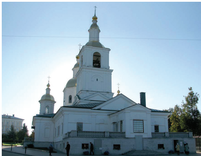
двухэтажный каменный храм во имя Рождества Христова

ва) будучи в Сарове обещала отцу Серафиму уступить ему эту землю.