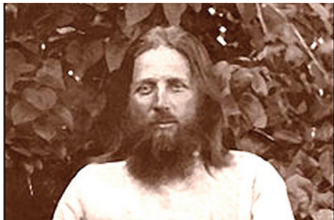
священномученик Иаков (Гусев)

подобного Серафима Саровского и святой блаженной Параскевы Дивеевской.