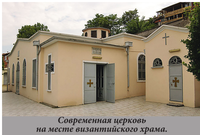
Современная церковь на месте византийского храма.

Сам праздник Покрова появился на нашей земле, вероятно, в XII веке. При этом считается (но теперь подвергается сомнению), что первым Покровским храмом стал шедевр древнерусской архитектуры – знаменитый храм Покрова на Нерли. Вообще же календарная история праздника до сих пор недостаточно исследована, хотя существует немало работ. Тем не менее, ясно, что традиционная (горделивая!) точка зрения на то, что это «чисто русский праздник», ве-